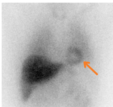
Exemple de scintigraphie cardiaque à la MIBG (examen normal).

Fixation d'intensité normale de la MIBG sur le cœur (flèche orange)