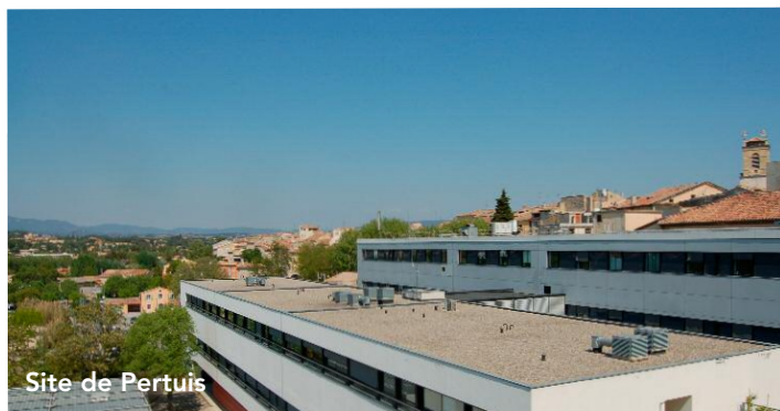
Site de Pertuis

La maternité Catherine Baret, structure de proximité, est associée à la maternité de niveau II B de l'hôpital d'Aix-en-Provence. Les familles bénéficient ainsi d'une offre complète autour de la femme et de l'enfant.